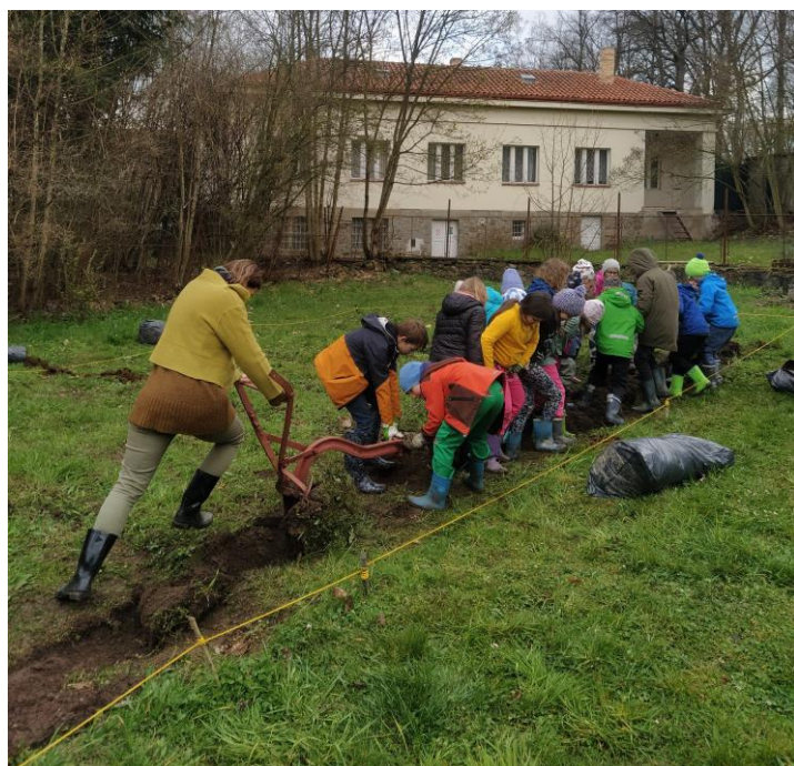
3. třída při orbě políčka – projekt Ze zrna chléb