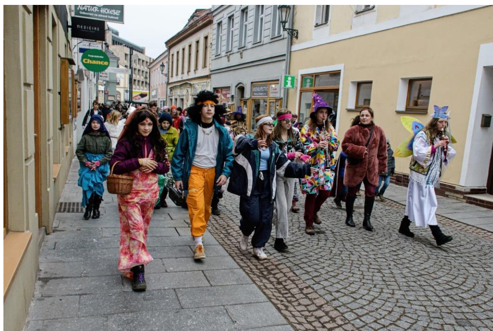
Masopustní průvod městem