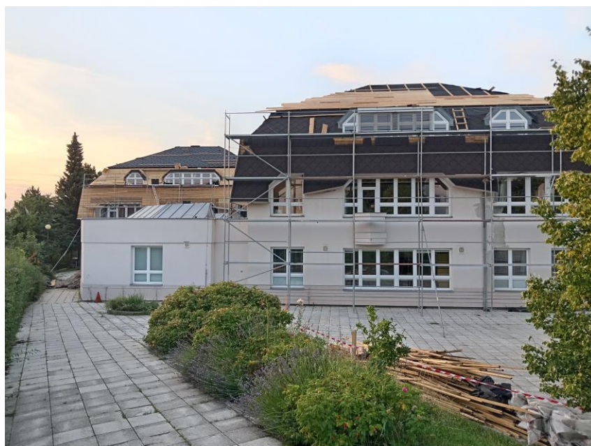
Oprava střech na budově Hornická 327 započala 1. 6., termín dokončení 31. 10. 2023