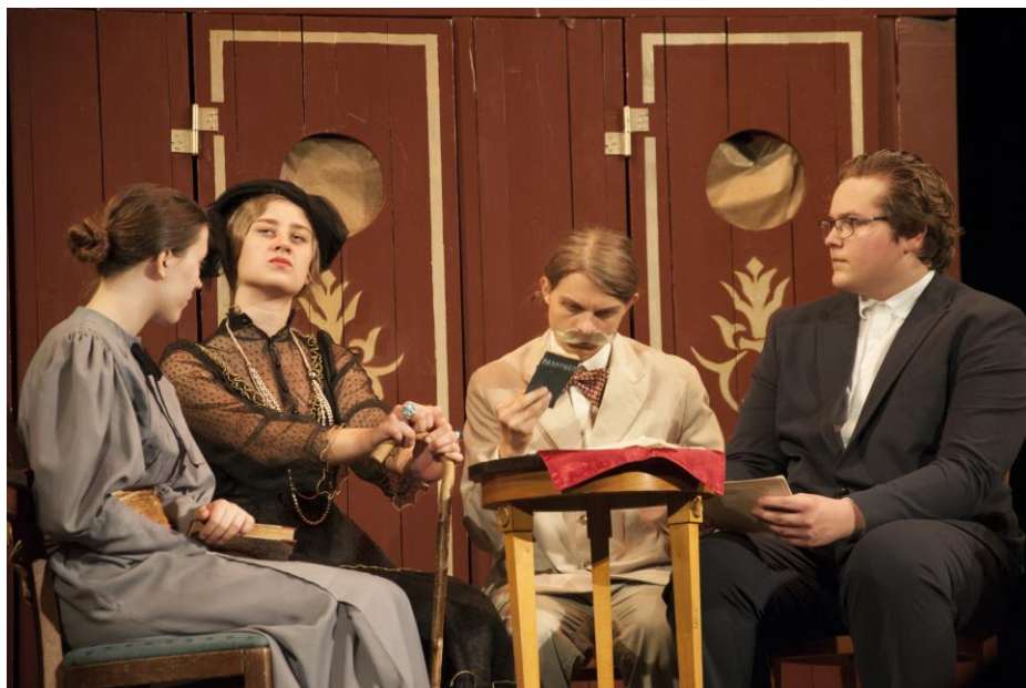
Ročníkové divadlo třídy 12L – Vražda v Orient-expressu.

Pojetí a cíle oboru: Vzdělávání v oboru Kombinované lyceum má perspektivní a dynamizující povahu – směřuje k vytváření osobnostní identity žáka na základě všeobecně kulturních, společenských a mravních hodnot, k růstu jeho sociální zralosti a kompetence, k osvojení širokého vzdělanostního základu i odborných předpokladů pro další studium v rámci zvolené specializace. Při studiu budou u žáka pěstovány nejen jeho poznávací schopnosti, ale také sociální citění a umělecké vnímání, získá praktické zkušenosti z řady činností. To dává žákovi předpoklady aktivně, svobodně a zodpovědně utvářet jak svůj vlastní život, tak přispět svým dílem i k utváření společenských poměrů. Být aktivní a flexibilní v podmínkách rychle se měnícího globalizujícího se světa. Široký vzdělanostní základ a praktické zkušenosti mohou být pro něj východiskem pro celou řadu pozdějších specializací, umožňují mu pružněji se přizpůsobovat podmínkám pracovního trhu a možnostem rekvalifikace v širokém spektru oblastí.