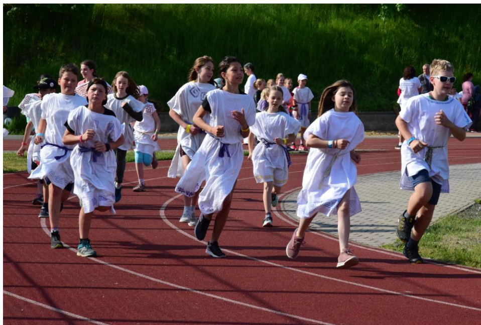
Olympiáda 5. tříd waldorfských škol ve dnech 26.-28. května v Příbrami – Stadion pod Svatou Horou.