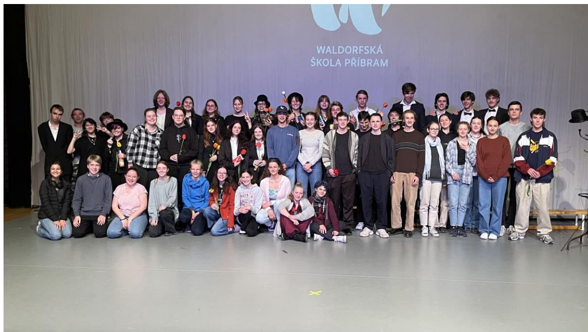
Společné foto žáků Školy R. Steinera Birseck a 11. třídy lycea Příbram.

Kolegium naší školy navštívilo v rámci poznávací cesty do Goetheana ve Švýcarsku waldorfské školy ve Stuttgartu a v Dornachu. Zde byla navázána volná spolupráce. Prvním krokem k jejímu naplnění byla týdenní návštěva Školy Rudolfa Steinera Birseck s provedením Mozartovy Kouzelné flétny.